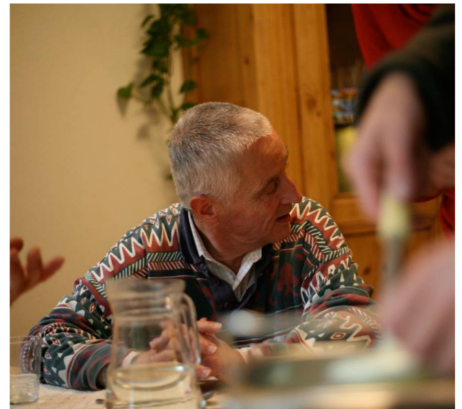
12.30 uur: Middageten.