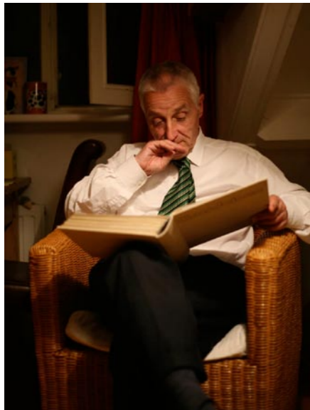
19.00 uur: Lezen op de kamer.