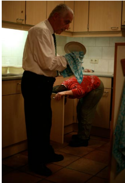
18.30 uur: Afdrogen!