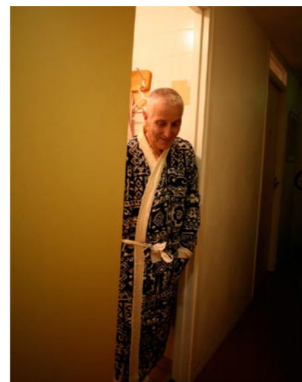
17.00 uur: Na het werk douchen en omkleden.