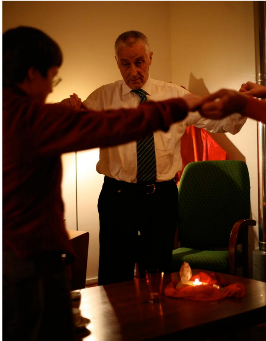
20.45 uur: Gezamenlijke afsluiting van de dag.