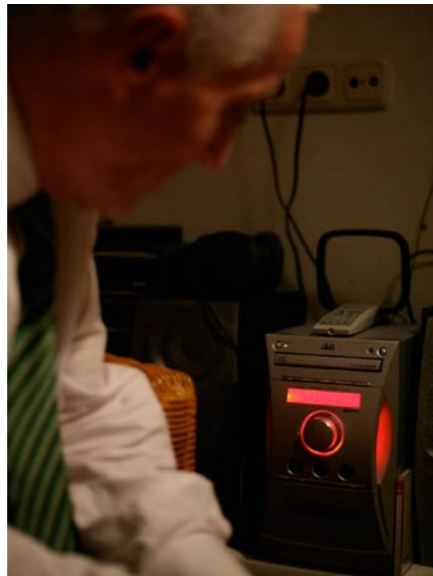
21.00 uur: Luisteren naar een voetbalwedstrijd.